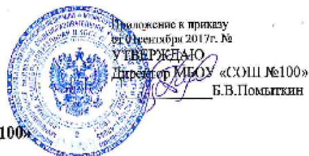
Структура управления МБОУ «СОШ №100»

Управление МБОУ «СОШ №100» строится на принципах единоначалия и коллегиальности.